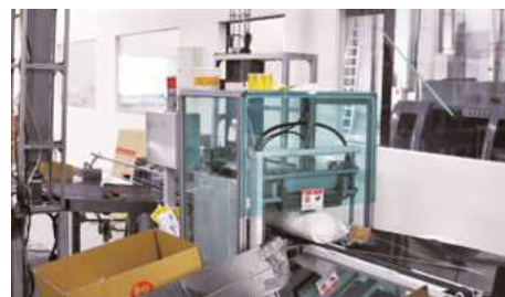
Automatic Packing Machine 自動包裝機