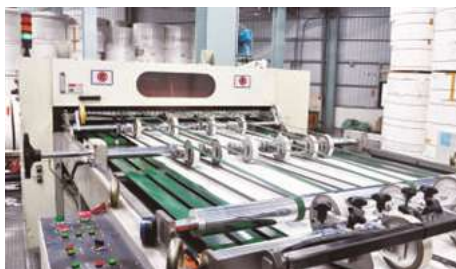
Paper Cutter 裁切機