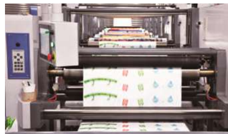
Flexographic Printing 環保水墨凸版印刷機