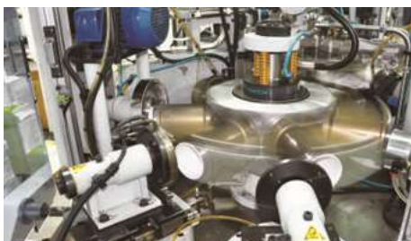
Paper Cup Forming Machine 紙杯成型機