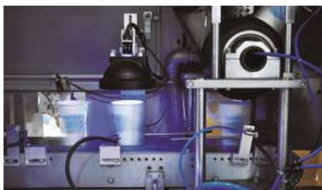
Inspection Machine 紙杯檢測機