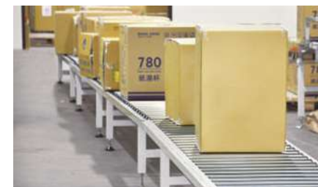
End Product 成品運送入倉