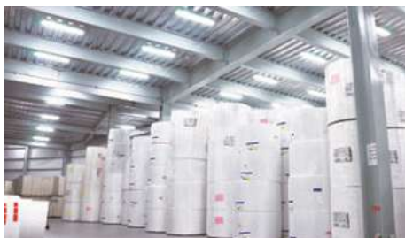
Paper Rolls Warehouse 原紙倉庫