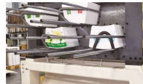
Die Cutting 模切機